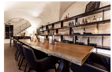
Impressionen der verschiedenen Restaurations-räumlichkeiten im Schloss Maienfeld.

Ambiente. Highlights sind etwa die Lichtführung in den historischen Räumlichkeiten und der begehbare Weinschrank im Restaurant. Dennoch atmet das Schloss nach wie vor Geschichte: Der Esprit mit seinen Geschichten um Eroberer, Ritter, Hofdamen und – wenn's denn sein soll – den Schlossgespenstern ist geblieben.